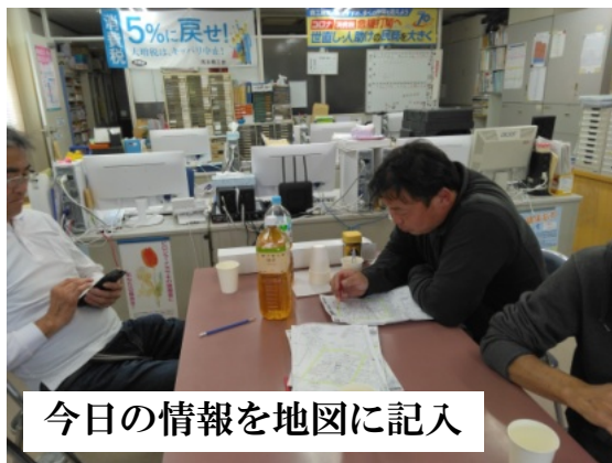
今日の情報を地図に記入