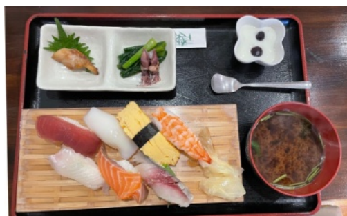
新鮮な魚で作られたお寿司