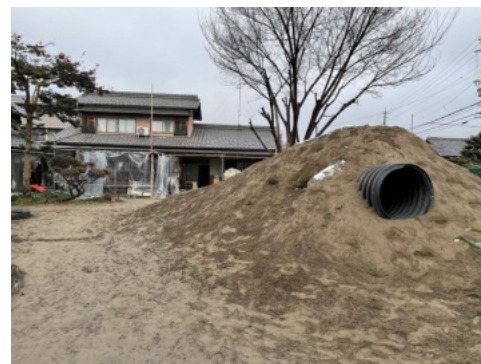
何トンもの土を入れて、山を作られたそうです。