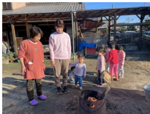
寒い今の時期には朝たき火、みんなで温まるそうです。