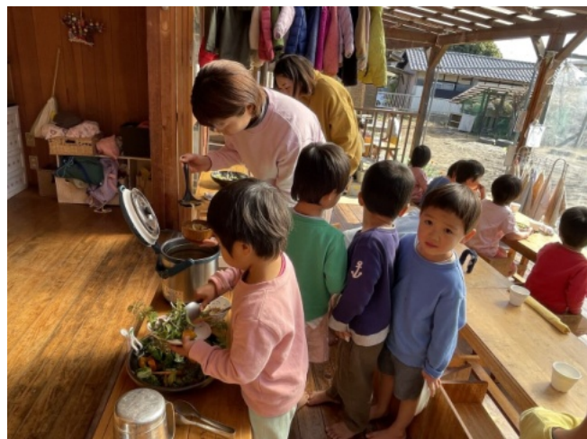
自分で食べられる分を自分で持って来て食べる お昼ご飯、とてもおいしそうでした。

自分で考えて自分で動ける 子どもの要求に大人も一緒に考える 大人の要求に子どもも一緒に考える