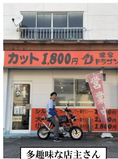
多趣味な店主さん

てもらっていただきながら、毎日明るく・楽しく営業しております。地域の学生から社会人、シニア世代の皆さまが家族揃って、気軽にずっと通えるようなお店作りを目指しています!