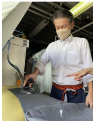
作業中にお邪魔しました

洋服の事で相談をすると、一緒になって考えてくれる、とても頼れるアイピアさんご夫婦の、やさしさに包まれたお店です。